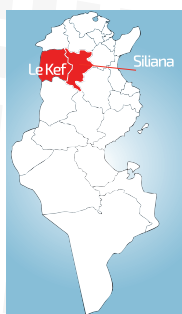
Plan de Situation et bassin versant du barrage Tessa

*MDT : Millions de Dinars Tunisiens et MUSD : Millions de Dollars USA